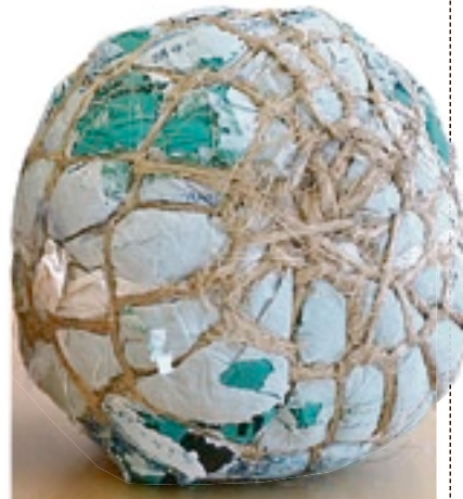
Rollt auch: Fussball Marke Eigebau.