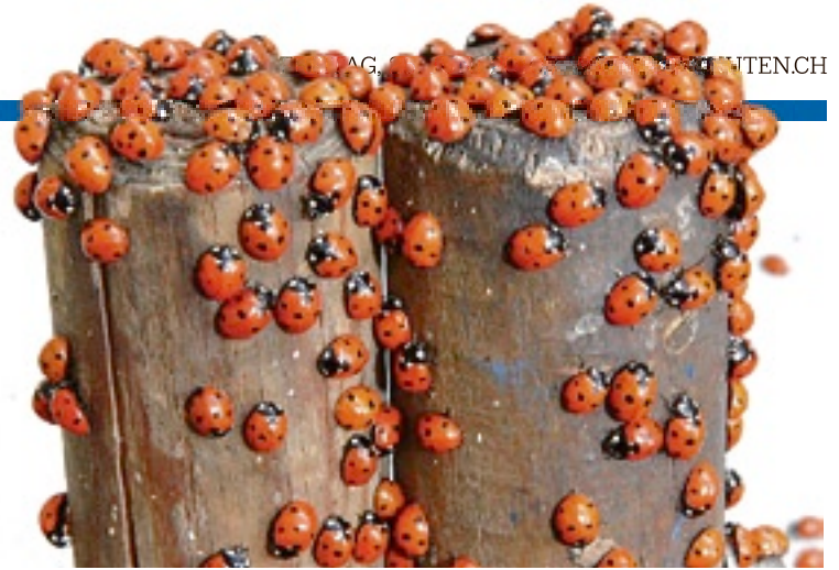
Als Nützling eingeführt, jetzt eine Plage: Der asiatische Marienkäfer.

Die Grösse der so genannten Mikrogele verändert sich je nach Temperatur: Dadurch können sie zarteste Gewebeschichten durchdringen. Die räumliche Ausrichtung gelingt dank feinsten Eisenstäbchen, welche die Wissenschaftler in die Mikrogele eingebettet haben. Mit Magnetkraft kann man diese – und damit den medizinischen Wirkstoff – an den Bestimmungsort im Körper leiten.