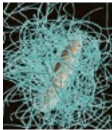
Mikrogel. UNI FREIBURG

FREIBURG. Mit Hilfe neuerartiger Nanopartikel könnte es bald möglich werden, Wirkstoffe von Medikamenten exakt dort zu platzieren, wo sie gebraucht werden. Denn die winzigen Partikel, welche am Physik-Departement und am Adolphe-Merkle-Institut der Uni Freiburg ent-